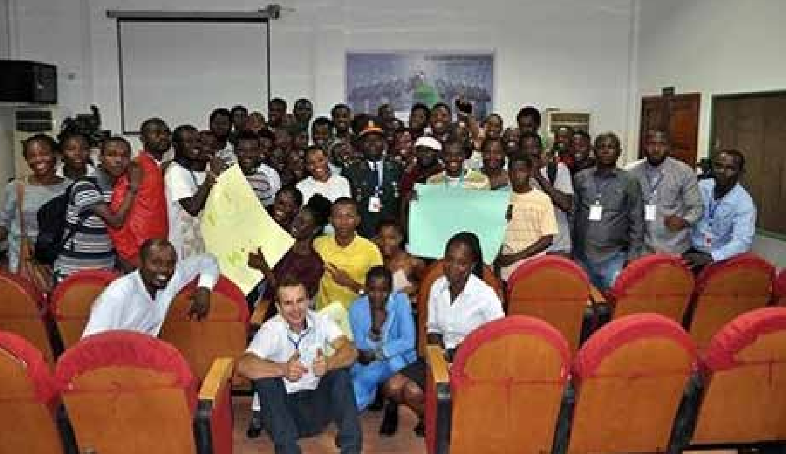
Atividade Genoma da Inovação – INNOVACITIES.

Em 2013, voluntariamos na 10ª Semana Estadual de Ciência e Tecnologia do Espírito Santo, com presença recorde de 153.000 visitantes em 4 dias de evento, tornando-a a maior do país. A ABIPIR organizou neste evento a sua maior edição da Feira Internacional de Inovação InnoWorld e ingressou na IFIA – International Federation of Inventors' Associations ( ifia.com ), principal entidade mundial do setor, com sede em Genebra (Suíça) e 140 instituições de inventores associadas em 95 países.