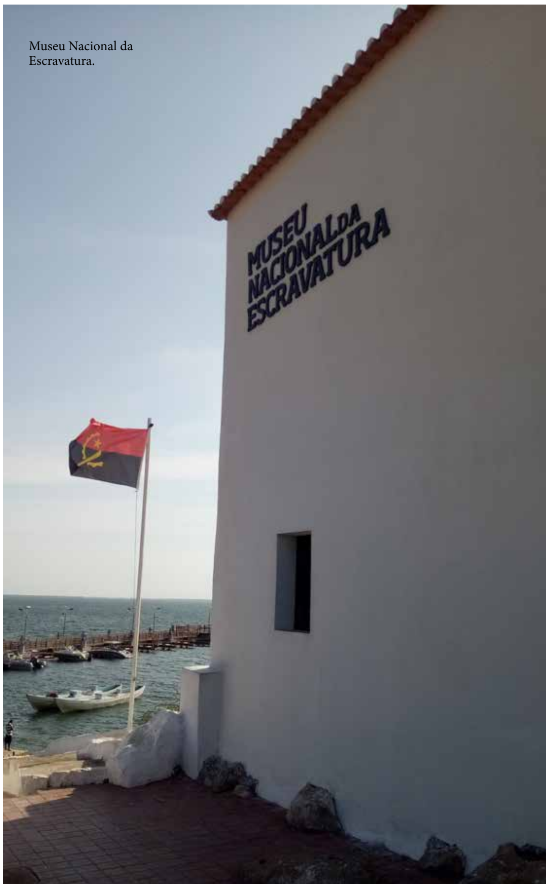
Museu Nacional da Escravidura.