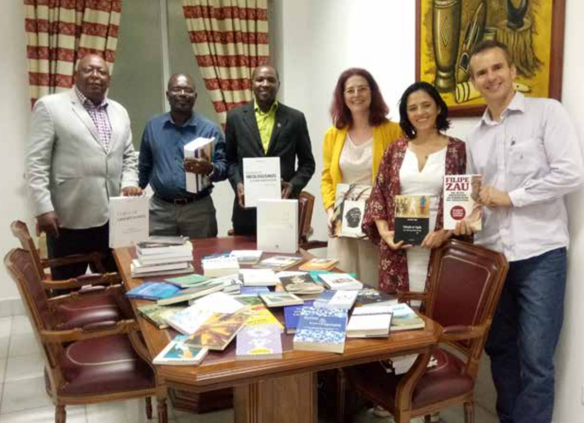
Doação de livros na biblioteca da UNIA.

Agradecimentos. Registro aqui a gratidão à equipex amparadora, que, generosamente, permitiu-me viajar para conhecer de perto a realidade angolana e iniciar a contribuição retributiva internacional pararreurbanizatória para tantos aportes recebidos por mim ao longo desta existência.