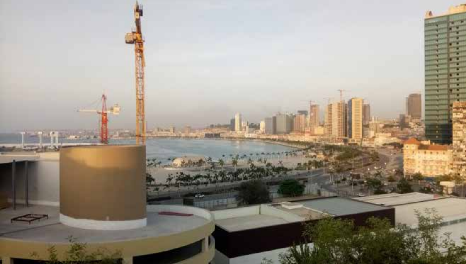
Baía de Luanda.

Vínculos. Essa experiência revelou interrelações e vínculos entre Angola e Brasil, os quais, embora conhecidos historicamente, tornaram-se palpáveis e impactantes presencialmente. Quanto à relevância da autopesquisa nesse período e das autoexperimentações, o princípio da descrença foi fundamental.